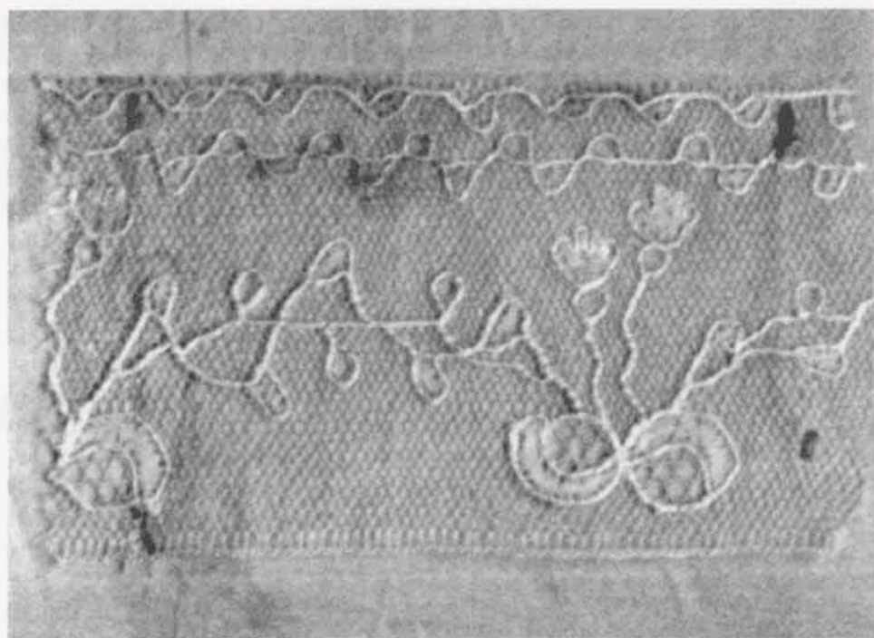
Muestra de blonda

La muestra de blonda que tanto agradó en 1793 a las ilustradas e ilustrados madrileños (Foto 1) parece encerrar en sus delicadas flores y hojas de hilo de seda el misterio de unas artesanas que han desarrollado durante siglos una técnica compleja y refinada de la que hoy casi nada sabemos.