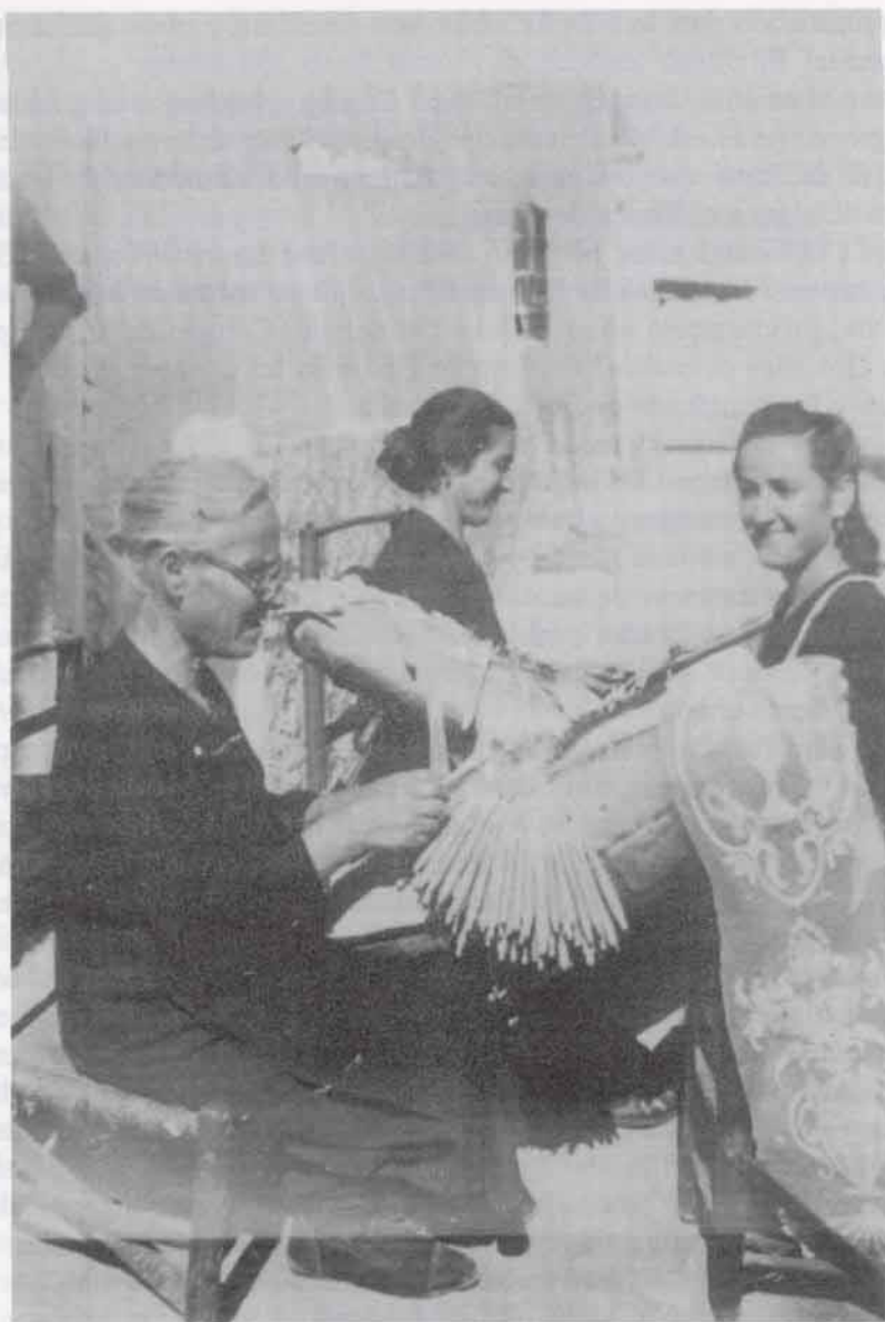
Grupo de encajeras de Almagro

Mujeres, como se les deba dar un ejercicio correspondiente a su sexo, fuerzas, e inclinaz.on lo será el de tejidos de Lenzos, fábrica de Blondas, y todo género de encages, y los niños, ancianos y ancianas se podrán ocupar en los abastos que